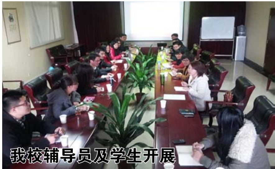
我校辅导员及学生开展